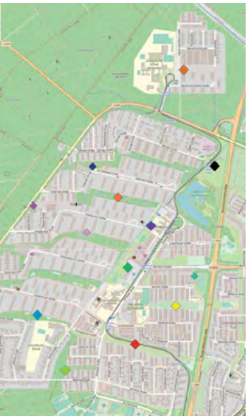
Hundetütenboxen in der Waldstadt

Man sieht und hört es vielerorts: die Waldstadt ist auf den Hund gekommen! Willkommen an alle neuen vierbeinigen Waldstädter!