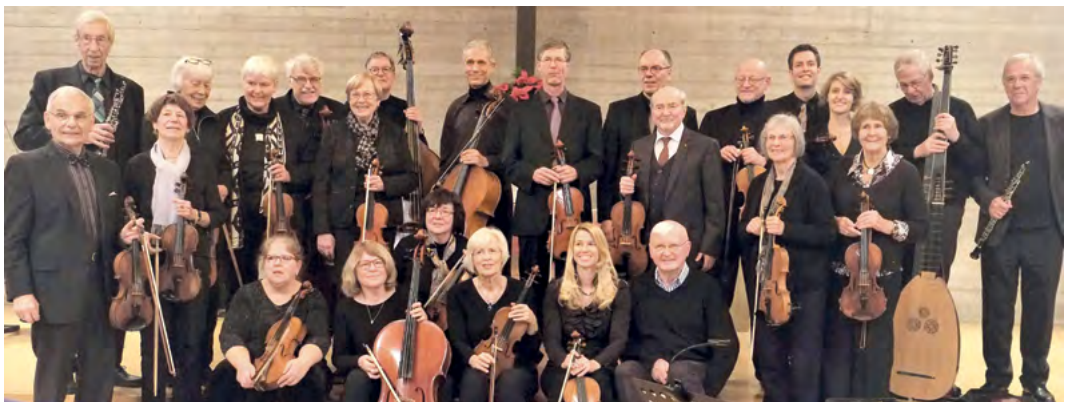
Das Ensemble der Waldstadtkammerorchester.

Wichtig für ein Orchester sind die öffentlichen Auftritte, das Geprobte zu präsentieren. allein oder zusammen mit Kirchenchören oder örtlichen Gesangsvereinen, bei Festakten oder Gottesdiensten, Kongressen und Tagungen. Viel trugen dazu Konzertreisen bei, die das Wald-