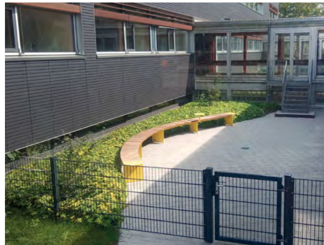
Neu angelegter Innenhof nach Renovierung.

In den Sommerferien konnte dort das Gras ungestört wachsen und erstrahlte zum Schuljahresbeginn in sattem Grün. Die Innenhöfe stehen künftig für Erholungsphasen zur Verfügung, wahrscheinlich ziehen auch bald wieder Schulkanninchen ein.