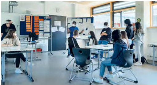
„Monolizien“ zeigt, wie wichtig Demokratie ist.

Zum Ende des Schuljahres nahmen die Schülerinnen und Schüler der Klassen 9c und 9d bei einem Planspiel zur Demokratiebildung des Medienkompetenzteam Karlsruhe ( www.medienkompetenz.team/ ) teil. Das Planspiel „Monolizien“ führte den Realschülerinnen und Realschülern vor Augen, wie wichtig Demokratie für eine freie und offene Gesellschaft ist und wie schnell Mechanismen kippen können und Diskriminierungen entstehen können, wenn die einzelnen Säulen einer Gesellschaft gleichgeschaltet werden. Herzlichen Dank an das Medienkompetenzteam Karlsruhe für den spannenden Vormittag.